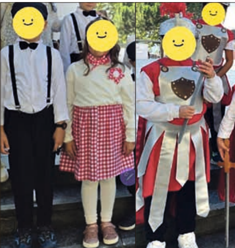
© Caroline Abramov / Mara Cristiani

Comme chaque année depuis passé 30 ans, une équipe de bénévoles s'occupe de confectionner les costumes pour la fête des vendanges pour les classes de primaires de l'école de Paudex.