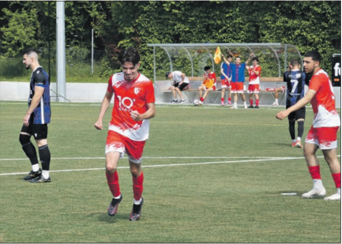
D'un côté la joie de l'autre la déception

Texte : Jérôme Marendaz Analyse du sondage : Arnaud Marendaz et Daniel Brunner