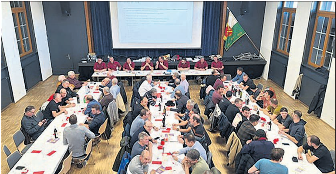
Vue du Conseil avec les anciens et nouveaux membres de celui-ci

Faute d'autres propositions, l'abbé-président lève la présente assemblée à 15h23 pour passer à la traditionnelle verrée, en souhaitant à chacun un bon retour dans son foyer, ce que tous les Frères d'Armes présents remercient par leurs applaudissements.