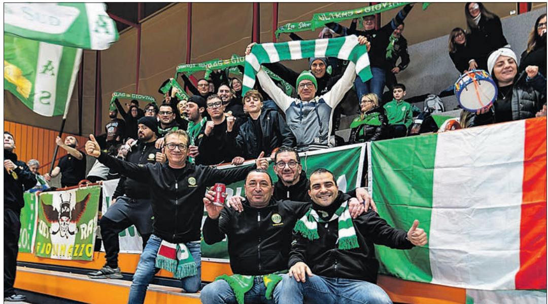
Les Ultras de Giovinnazzo, un enthousiasme communicatif

En attendant, ce samedi à 18h , retour au championnat suisse avec un déplacement