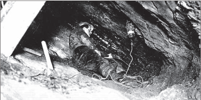
Un mineur au travail