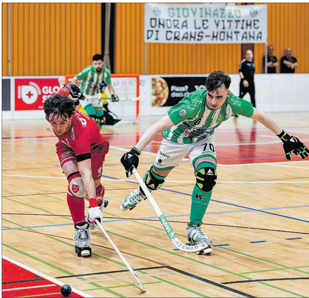
La tragédie de Crans-Montana était dans tous les esprits. Les Ultras ont accroché une banderole, les Pulliérans ont joué un brassard au bras