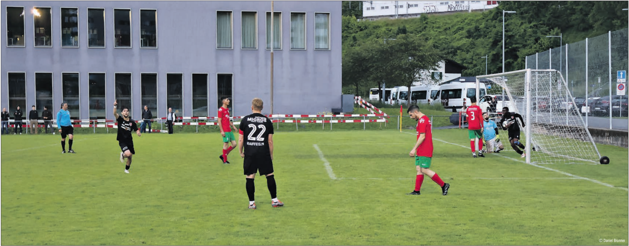
Un but, deux ambiances, une équipe célèbre, l'autre a la tête baissée

L'important, c'est les trois points, «un derby, ça ne se joue pas, ça se gagne», «à domicile, il n'y a qu'un seul résultat: la victoire».