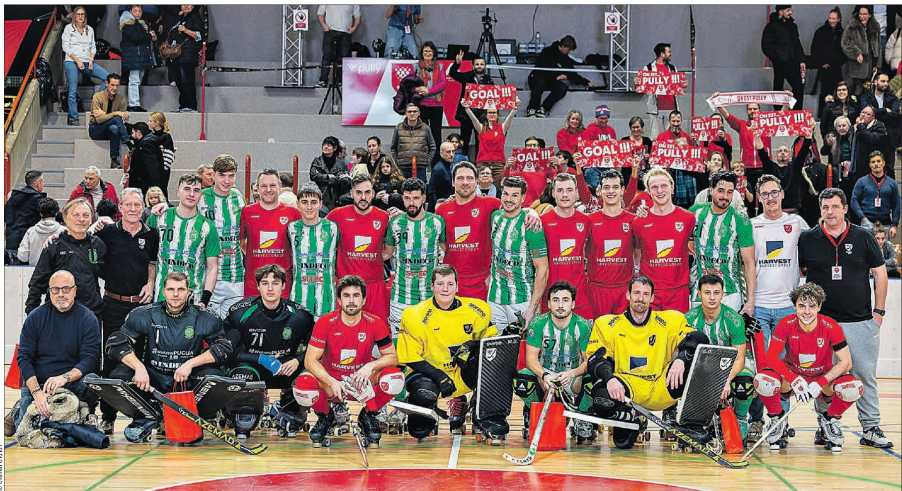
Après le match, les deux équipes se sont réunies avec leurs dirigeants pour la photo finale. Même en Coupe d'Europe, le rink-hockey reste une grande famille

Pendant les 10 minutes qui ont suivi, les actions se sont succédé de part et d'autre. Les Giovinnazzesi, par la fulgurance et la rapidité de leurs actions, donnaient l'impression de pouvoir à tout