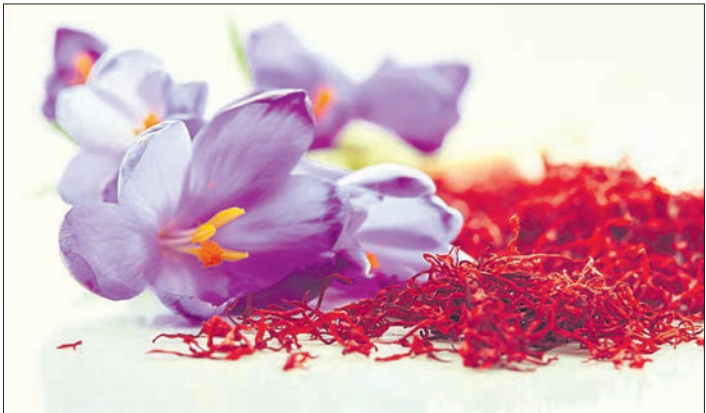
Il faut 150 à 200 crocus pour obtenir un seul précieux gramme de safran

mencé à planter des crocus, les limaces perçaient les feuilles et mangeaient les fleurs. Mais aujourd'hui, il n'y a plus de limaces. Ce sont mes canards qui les bouffent ! »