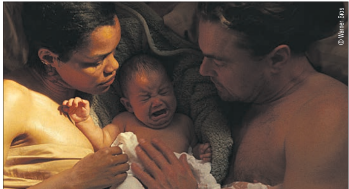
L'enfant de Perfidia (Teyana Taylor) et Bob (Leonardo DiCaprio), vient de naître

Une bataille après l'autre de Paul Thomas Anderson, 2025, États-Unis, VostFR, 2h40 À voir au cinéma de la grande salle de Chexbres, vendredi 16 et samedi 17 janvier, à 19h30