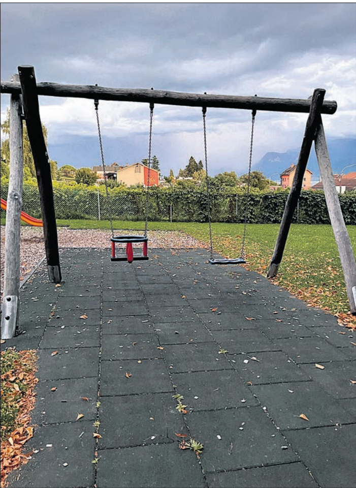
La Municipalité de Pully a présenté un préavis d'intention afin de faire le point sur les actions en faveur de l'enfance et de la jeunesse et de préparer l'élaboration d'un concept communal dès 2026

Sur le préscolaire (0-4 ans), Pully compte aujourd'hui 200 places en accueil collectif, soit un taux de couverture de 22,3 %. Or l'étude de besoins, citée dans le préavis, fixe un objectif théorique à 48,8 % : « Il manquerait, à terme, l'équivalent de 210 places supplémentaires pour tendre vers ce niveau », précise la documentation. Sans surprise, cette dernière détaille également que la