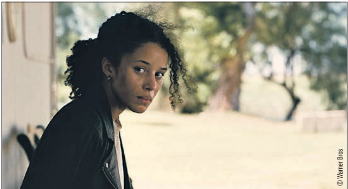
Willa (Chase Infinity) a été capturée