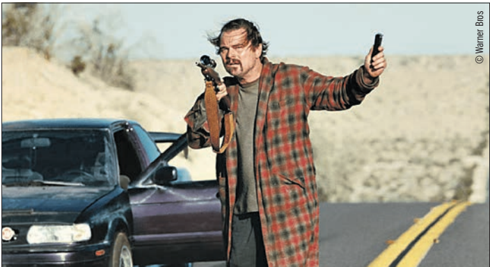
Bob (Leonardo DiCaprio), mitraille à la main, à la recherche de sa fille