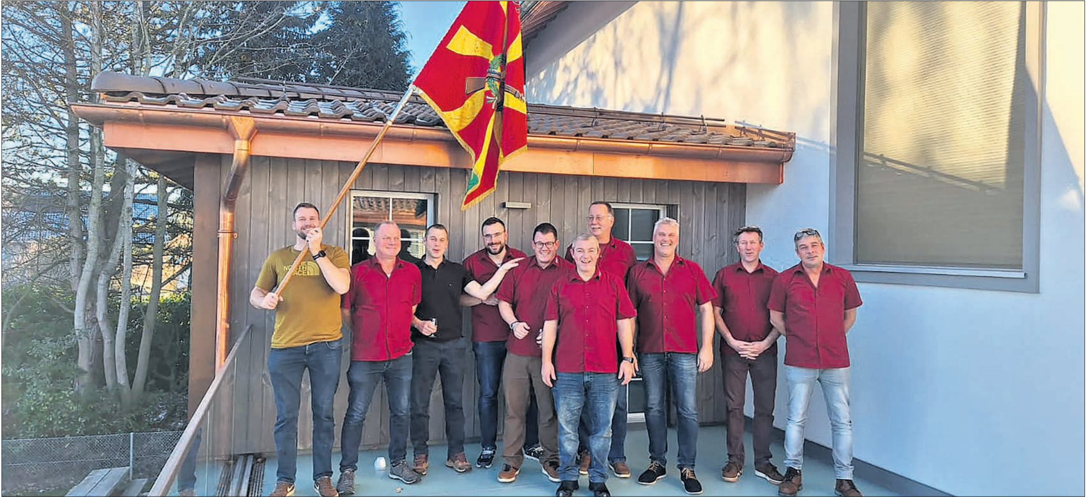
Les membres et le Conseil