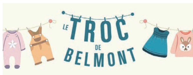
Troc de Belmont vous a proposé 2 rencontres durant l'année 2022, une rencontre enfants et une rencontre dames