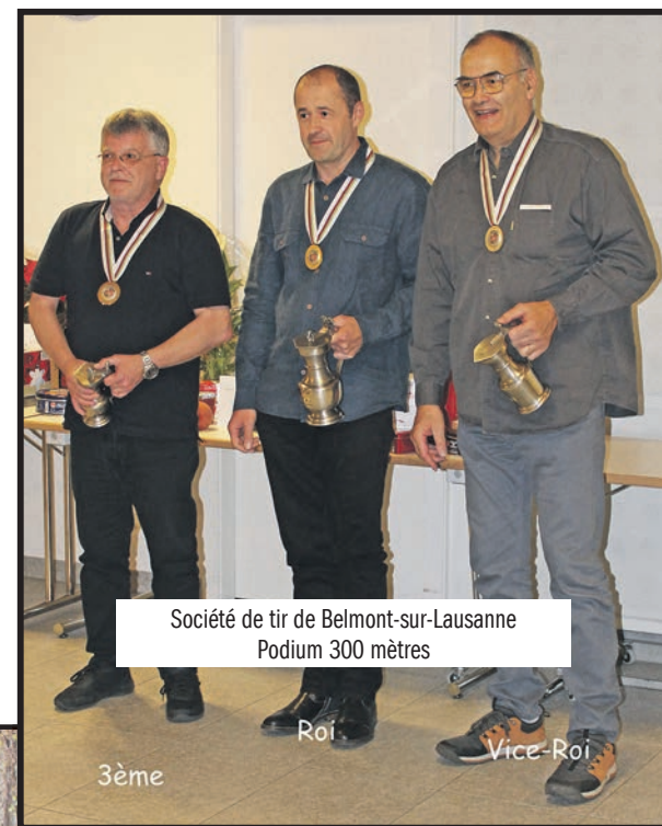
Société de tir de Belmont-sur-Lausanne Podium 300 mètres