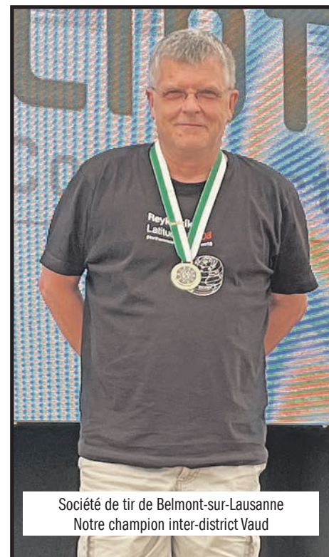
Société de tir de Belmont-sur-Lausanne Notre champion inter-district Vaud