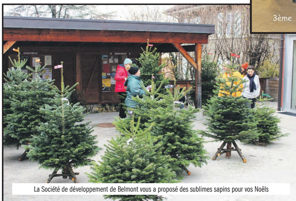
La Société de développement de Belmont vous a proposé des sublimes sapins pour vos Noëls