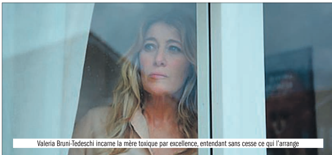
Valeria Bruni-Tedeschi incarne la mère toxique par excellence, entendant sans cesse ce qui l'arrange

LA LIGNE, fiction d'Ursula Meier, Suisse, 2021, 103', VF, 12/14 ans