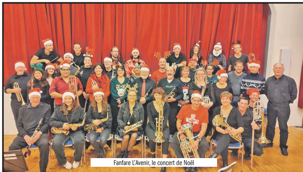
Fanfare L'Avenir, le concert de Noël