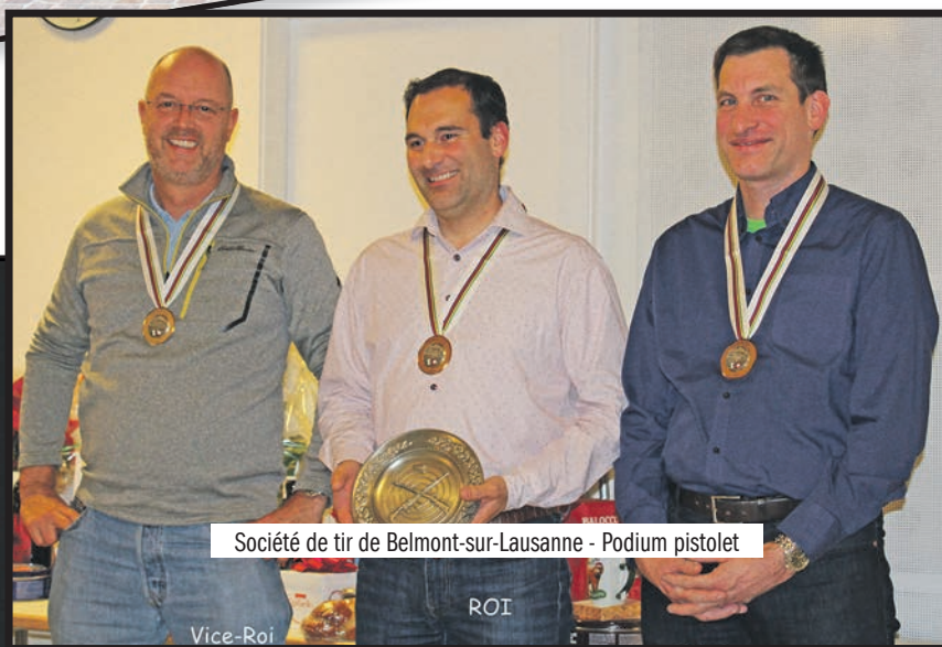
Société de tir de Belmont-sur-Lausanne - Podium pistolet