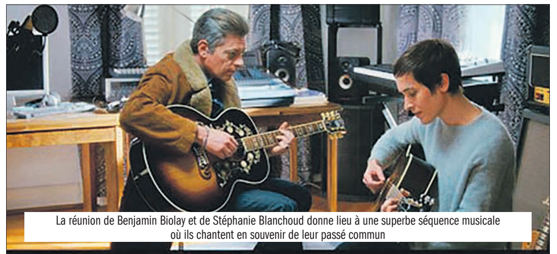
La réunion de Benjamin Biolay et de Stéphanie Blanchoud donne lieu à une superbe séquence musicale où ils chantent en souvenir de leur passé commun