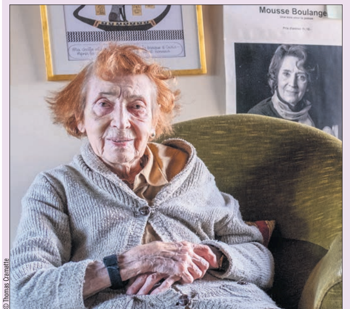
Mousse Boulanger était membre de nombreux comités de lecture

Poète, diseuse, comédienne, écrivaine, journaliste, productrice radiophonique, une grande dame des lettres romandes nous a quittés. Née Berthe Sophie Neuenchwander le 3 novembre 1926 à Boncourt, Mousse Boulanger est décédée dans la nuit de dimanche à lundi accompagnée de sa petite-fille à l'hôpital de Payerne.