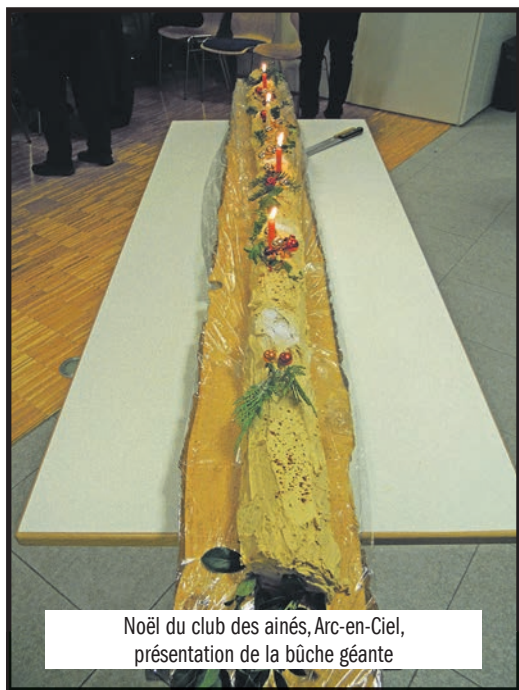
Noël du club des aînés, Arc-en-Ciel, présentation de la bûche géante