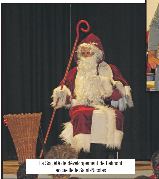
La Société de développement de Belmont accueille le Saint-Nicolas