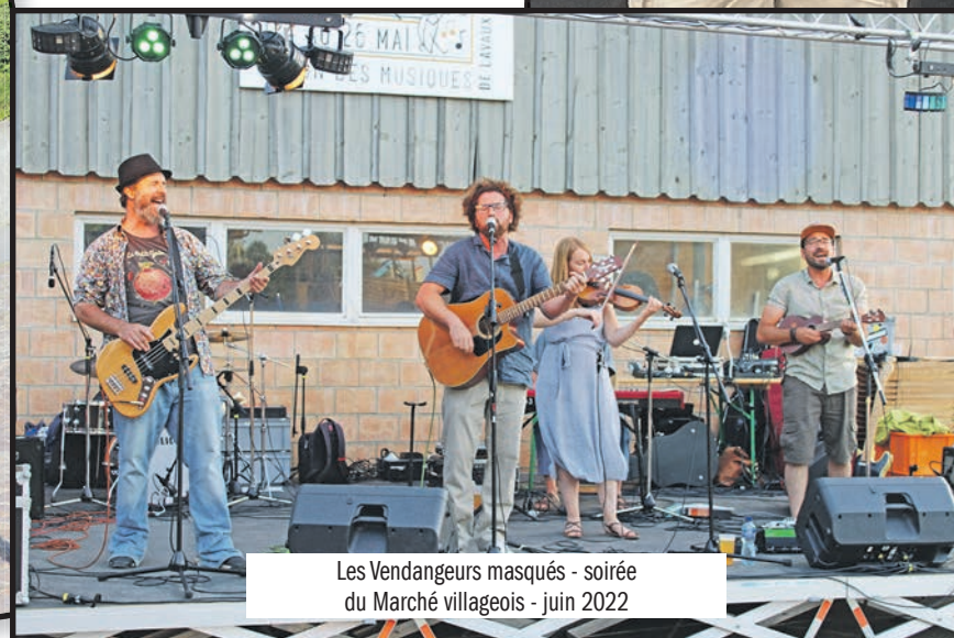
Les Vendangeurs masqués - soirée du Marché villageois - juin 2022