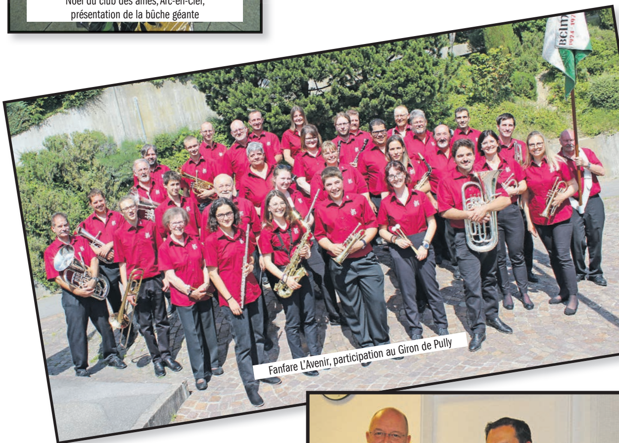
Fanfare L'Avenir, participation au Giron de Pully