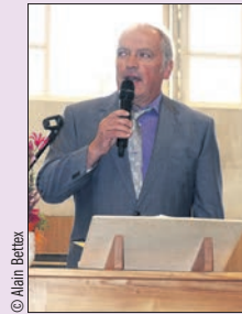
Le syndic lors de l'inauguration récente du collège de Carrouge