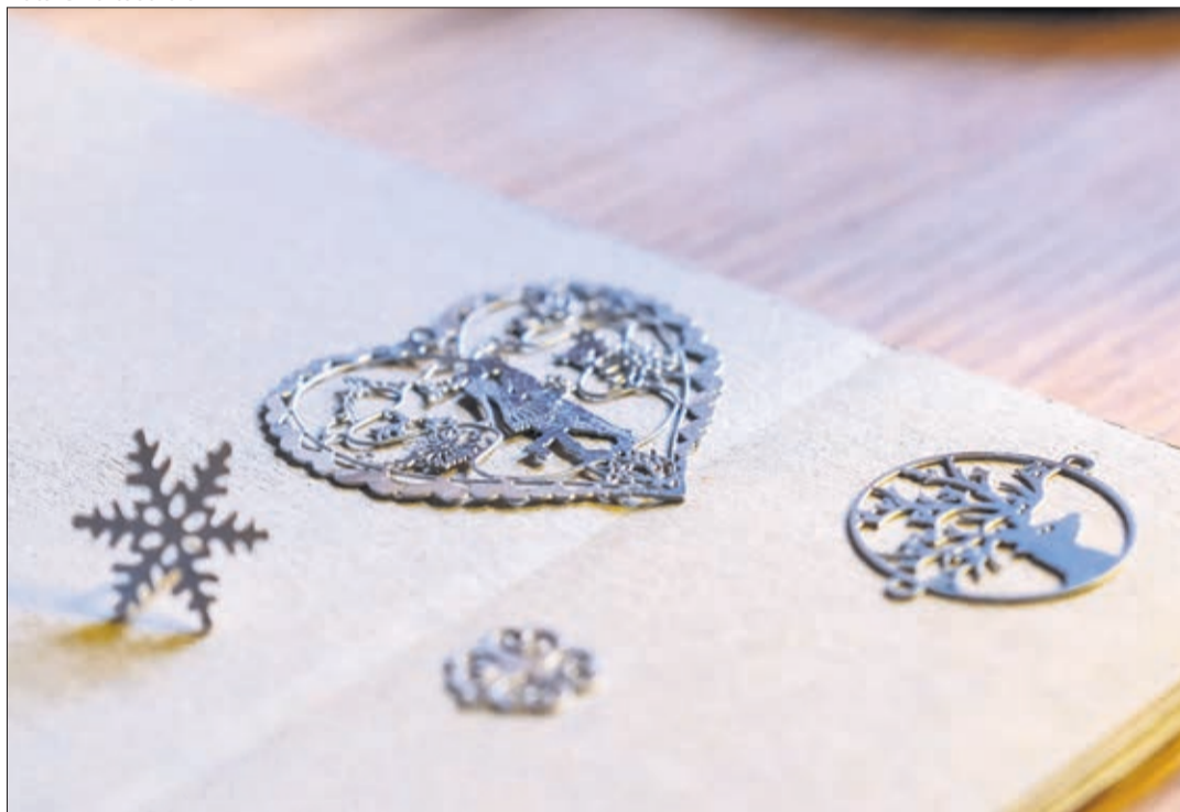
Pendentifs et bracelets