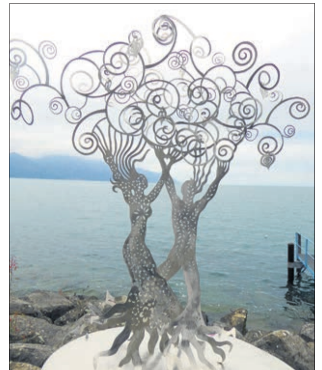
L'arbre de l'amour

Dans le futur, l'artiste d'Oron-le-Châtel souhaiterait réaliser plus de sculptures, qu'elles soient métalliques ou en toute autre matière. Son optimisme ne peut qu'être communicatif et nous lui faisons entièrement confiance pour nous émerveiller.