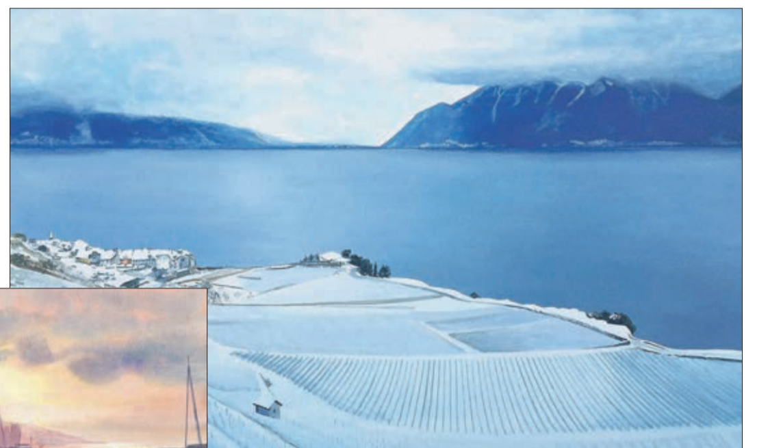
Rivaz dans la lumière de l'hiver - Acrylique sur toile

de l'art et ce qui appartient à la provocation.