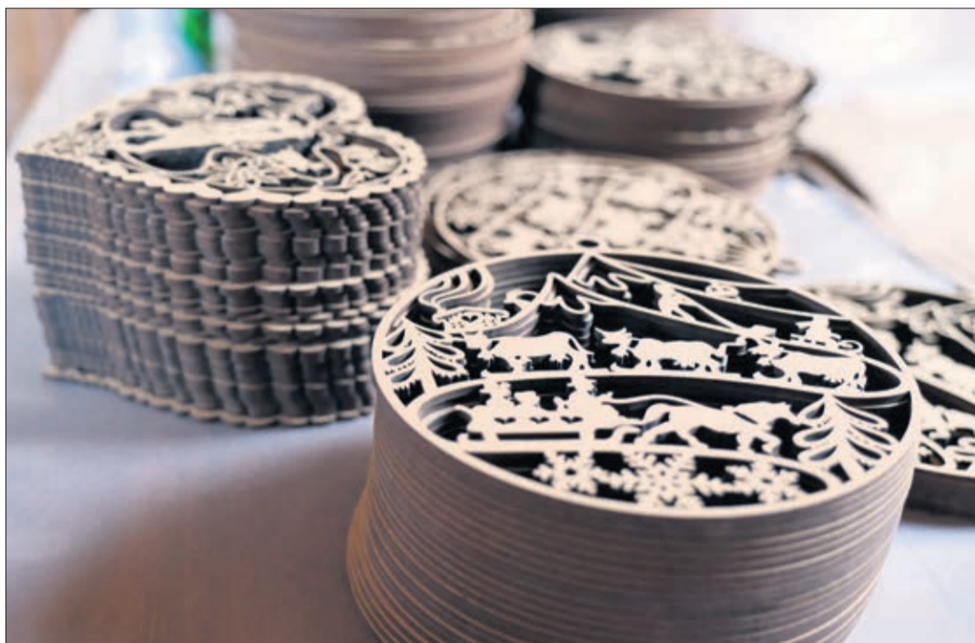
Les poyas à peindre