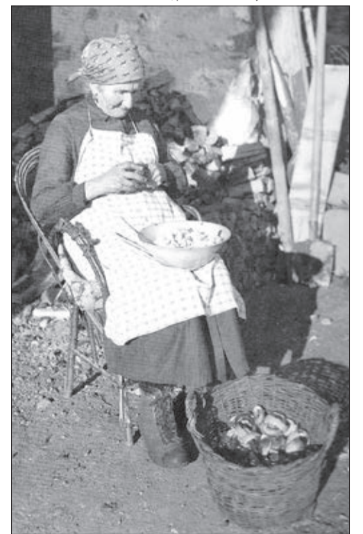
Une octogénaire qui décortique ses champignons

Photo: © Alexandre Dumas, père - Editions Ketty &amp; Alexandre