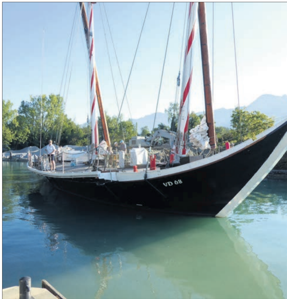
La Demoiselle à bord de laquelle sera donné le départ

Les cinq premiers, des trois catégories ci-dessus, ont longtemps navigué de concert. C'est sur le retour, au large de Meillerie, que les écarts se sont creusés, selon que les concurrents empruntaient le côté suisse ou français.