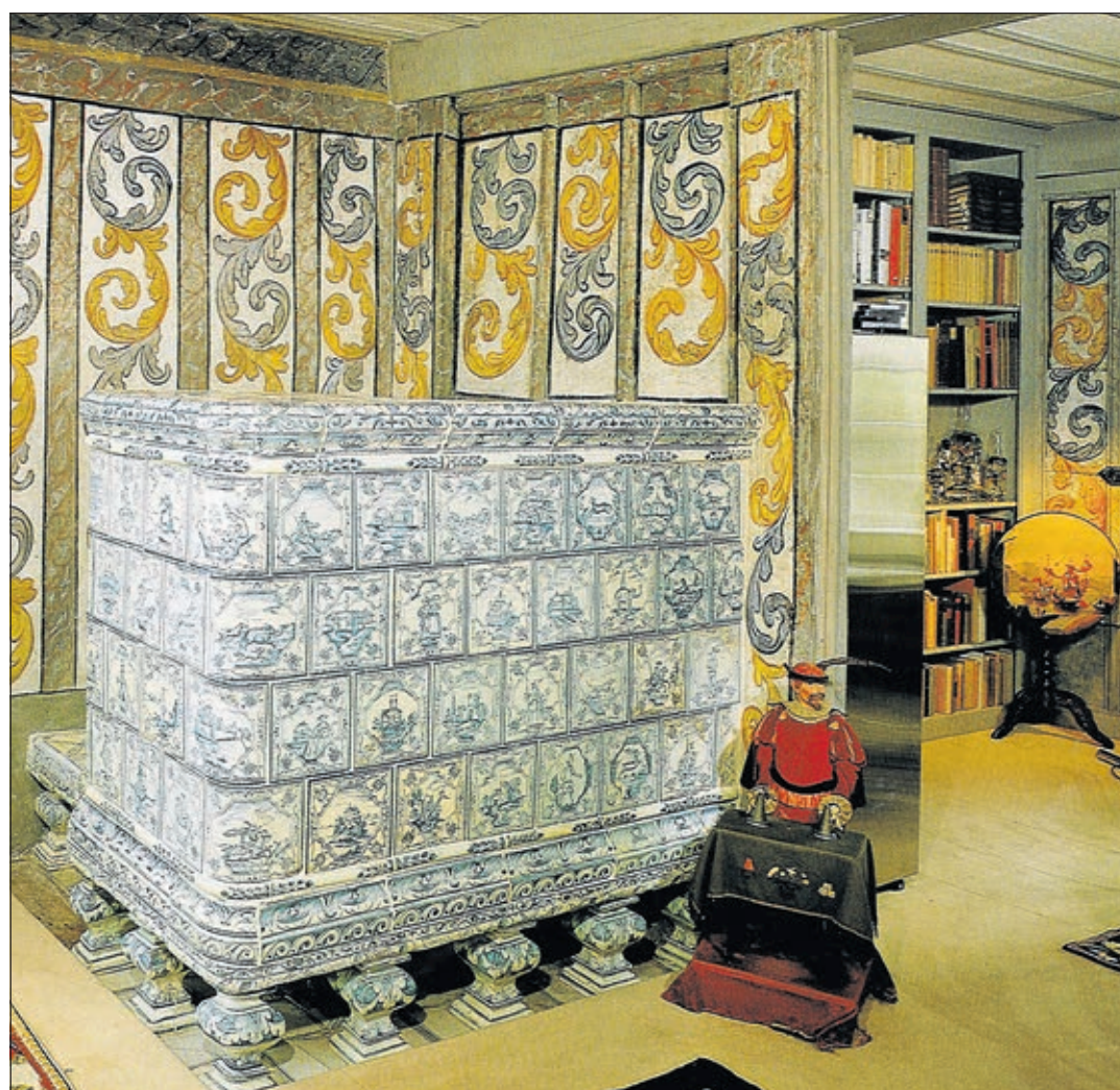
Ce magnifique poêle de 1750 au château d'Epends, est un véritable patrimoine. Photo tirée du livre «Poêles fribourgeois»