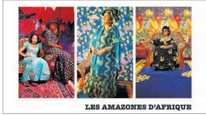
LES AMAZONES D'AFRIQUE

Les Amazones d'Afrique, le vendredi 31 mars au Chapiteau